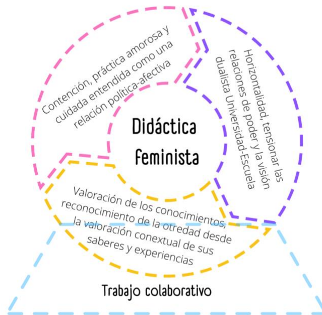
Fig. 2 Composición fotográfica de qué entendemos por trabajo colaborativo